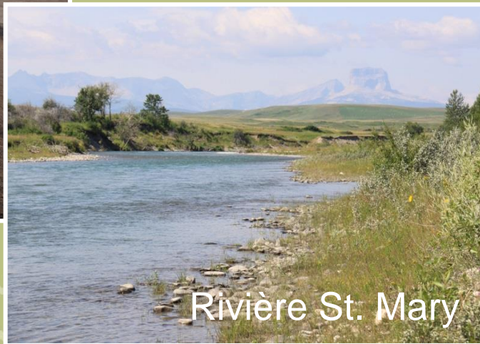
Rivière St. Mary