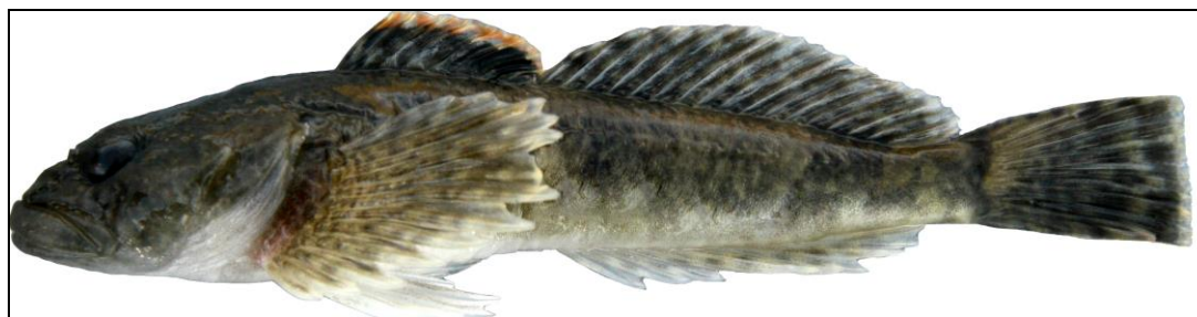
Figure 2. Chabot des montagnes Rocheuses.

Le chabot des montagnes Rocheuses (populations du versant est) est un petit poisson d'eau douce des grandes profondeurs appartenant à la famille des chabots ( Cottidae ), qui vivent principalement en milieu marin; il se caractérise par une grosse tête et un corps épais qui s'effile vers la queue (figure 1). Ces poissons sont endémiques en Amérique du Nord et les populations canadiennes sont généralement limitées aux tronçons de la rivière Flathead (Colombie-Britannique) et ses affluents, qui font partie du réseau hydrographique du fleuve Columbia (populations du versant ouest), ainsi qu'au réseau de la rivière St. Mary en amont du réservoir St. Mary, et aux rivières North Milk et Milk dans le sud de l'Alberta (figure 2). Le lien taxonomique qu'il partage avec d'autres espèces de chabot est mal connu (Young et al. 2013).