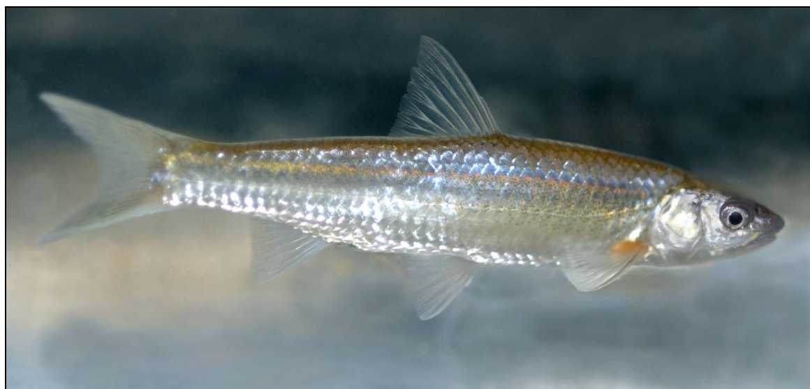
Figure 3. Méné d'argent de l'Ouest

Le méné d'argent de l'Ouest est un petit poisson du genre cyprinidé, indigène dans les cours d'eau des grandes plaines de l'Amérique du Nord. Sa tête est caractérisée par un museau arrondi avec une bouche subterminale et des yeux relativement grands (Scott et Crossman 1973) (figure 3). La présence du méné d'argent de l'Ouest a été observée pour la première fois au Canada en 1961, dans le cours inférieur de la rivière Milk, en Alberta (figure 1); il n'a pas été observé depuis dans nul autre réseau hydrographique du Canada (ASRD 2003). Les spécimens propres à l'Alberta tendent à être jaune brunâtre sur le dos avec des flancs argentés (Nelson et Paetz 1992).